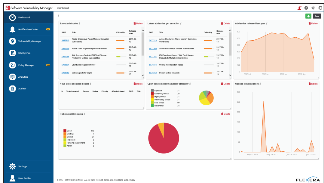
Abbildung 1: Software Vulnerability Manager Research zeigt Warnungen u. a. nach Monat, Kritikalität und Patch-Status an